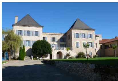
Site de Beauséjour