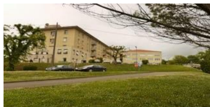
Site de Bellevue