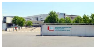
Le GHM « Les Portes du Sud ».