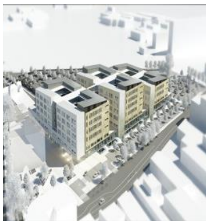
Plan du Médipôle

L'ouverture du Médipôle est prévue pour le premier semestre 2019.