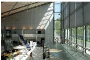
L'Institut Mutualiste Montsouris