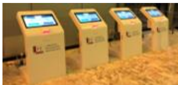
Les bornes d'accueil et d'orientation

A noter que l'IMM présente des durées de séjour plus courtes de 24% par rapport à la moyenne nationale (indice de performance : 1,24).